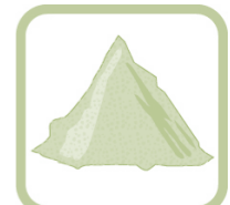
TERRE / DEBLAIS