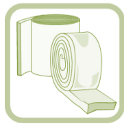
LAINE DE VERRE